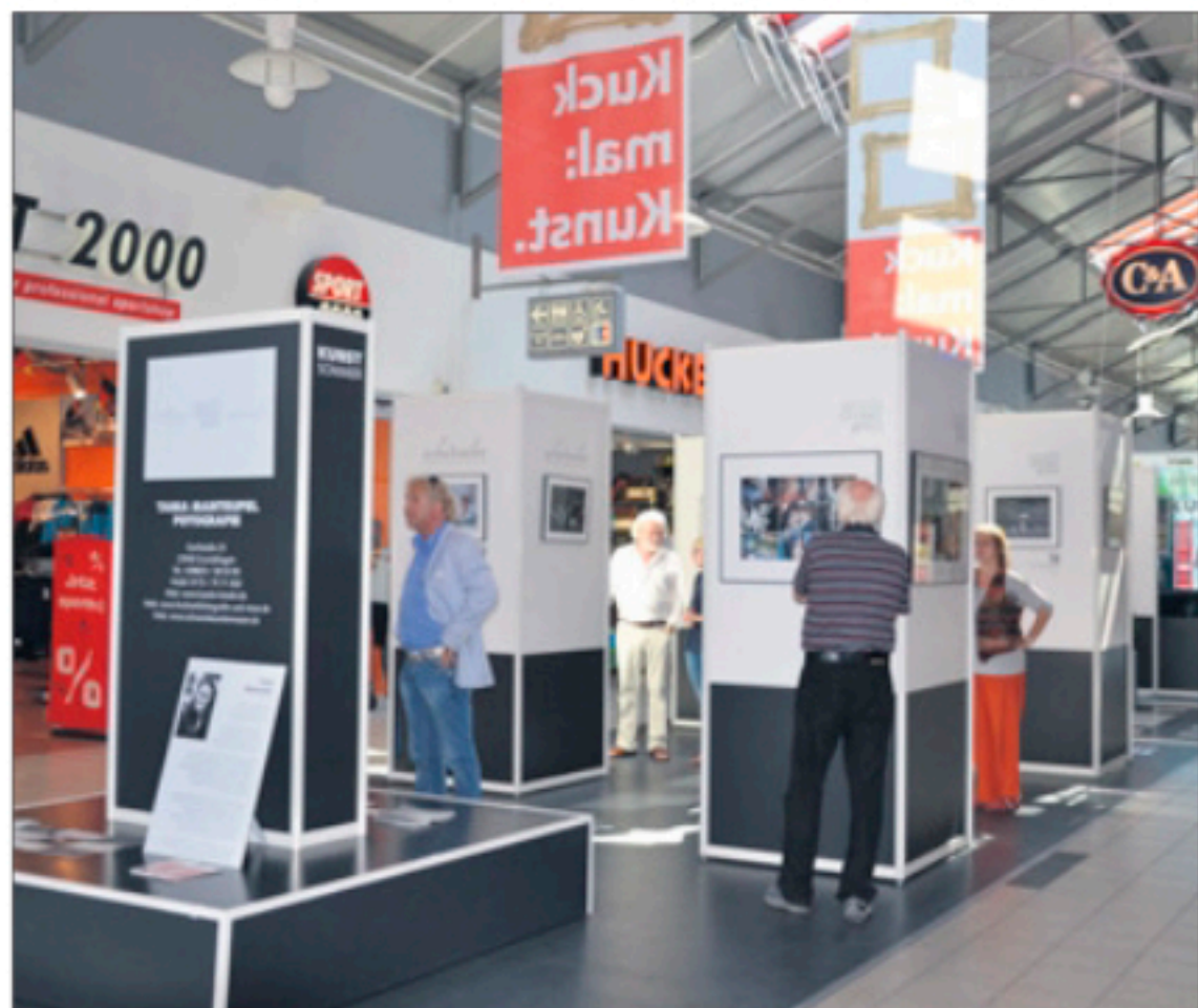
Kunstaussstellung im „Ostsee Park“.

Was ist Kunst, was ist kunstvoll? Bei der im „Ostsee Park“ angebotenen Bandbreite des kreativen Schaffens in Rostock und Umgebung wird der Besucher unvergessene Präsentationen erleben, die ihn selbst entscheiden lassen, in welche Richtung die eigenen künstlerischen Adern und Vorlieben weisen. Hier ein kleiner Vorgeschmack: Keramikünstler geben einen Einblick in die Kunst des Töp-